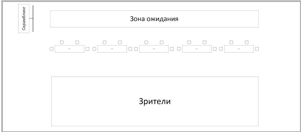
Пример расстановки - 5 столов, 10 мест для сборки, зона ожидания за участниками