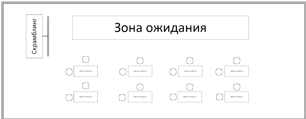
Еще пример — когда столы вмещают только одного участника